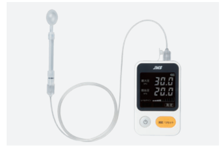
図1-6 低舌圧の検査に用いるJMS舌圧測定器。

器を用いた方法が推奨されますが、初めからすべて検査機器をそろえるのは難しい場合もあるかと思えます。そのような場合には、少しずつ検査機器を増やしていけばよいと思います。ただ、検査機器を用いた方が、より迅速に検査が実施可能です。検査の頻度が増えてきたら、検査機器を使用する方が効率よく検査を行えると思います。