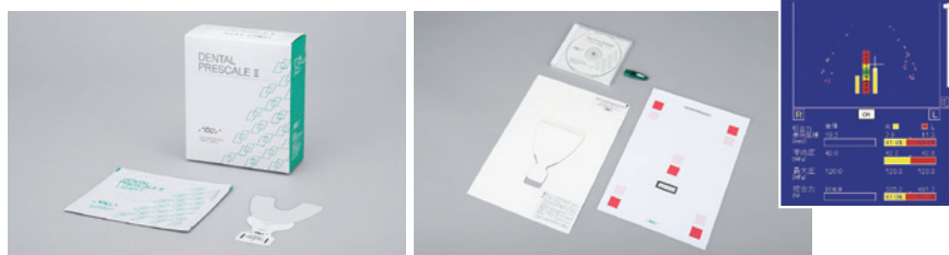
図1-5 口腔機能低下症の咬合力低下の検査と有床義歯咀嚼機能検査の咬合圧測定に用いるデンタルプレスケールⅡとバイトフォースアナライザ。