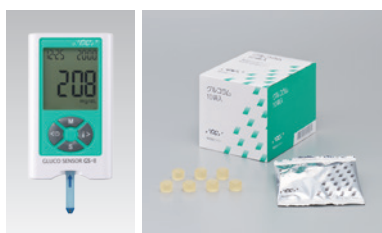
図1-4 口腔機能低下症の咀嚼機能低下の検査と有床義歯咀嚼機能検査の咀嚼能力測定に用いるグルコセンサー GS-IIとグルコラム(グルコース含有グミ)。