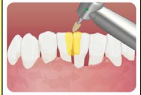
形態修正・研磨・咬合調整