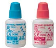
セラミックプライマー

被着面を口腔内サンドブラスト、あるいはダイヤモンドポイント等で新鮮面を出し、水洗の後、乾燥します。