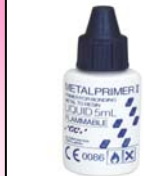
メタルプライマー II